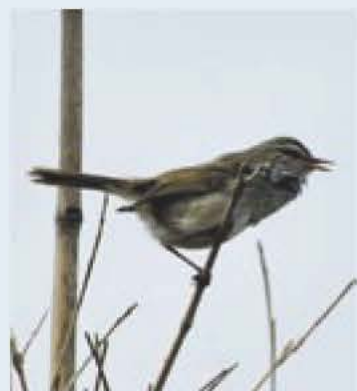
写真 鳥越治さん(鳥の博物館友の会) 文 時田賢(鳥の博物館学芸員)

ウグイスは、スズメと同じく らしい大きさの小鳥で、日本と その周辺地域にすんでいます。 一羽の雄が二羽以上の雌とつが いになる一夫多妻の鳥です。体 色は、俗にウグイス色といいま すが、実は茶色っぽい色をして います。高原の鳥のイメージが ありますが、最近では我孫子周 辺でも夏に鳴き声を聞く機会が 多くなりました。冬に雪が降る