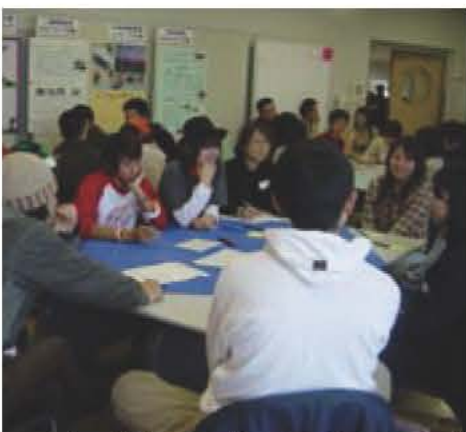
語り合う学生たち(市民活動フェアで)