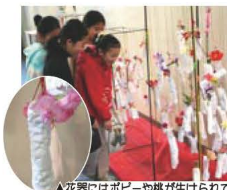
▲花器にはポピーや桃が生けられて

4回目となる今年は、ハートいけばな会会員が制作した紙粘土の花器に、「我孫子市いけばなこども教室」の33人が花を生けた作品(写真)も、展示されました。