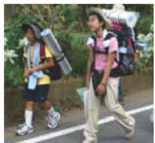
昨年のチャレンジ・ウォーク

「子ども総合計画」を確実に実行し、「いちばん子育てしやすいまち」を目指します。 魅力ある都市環境や個性的な商店づくり、交通便利性の向上などに取り組み、若い世代の定住化を促進していきます。 *「子ども総合相談窓口」の相談員を増員。虐待を受けた子どもへのケアを充実します。 *子ども交流拠点は、施設の基本設計を行います。 *「ABIKOチャレンジ・ウォーク2006」は、定員を42人に増やし8月に実施します。 *小学生の長期農業体験は、約半年の期間で、畑の土作りや種まき、収穫などの農作業や農家での宿泊を体験します。 *恵愛保育園の新築工事を補助し、07年度に定員を30人増やし150人とします。4月には、