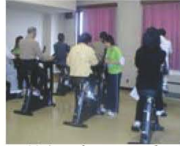
健康サポートクラブ

「健康寿命」を伸ばすことを目標に、健康に関するさまざまな取り組みを体系的に進めます。 各種検診を充実させるとともに、「食育推進計画」の指針づくりに取り組みます。 市民が、身近な施設で気軽にスポーツを楽しみ、健康づくりができる環境づくりを進めます。 *「前立腺がん検診」や「妊婦の歯科健診」を始めるとともに、「子宮がん検診」と「骨粗しょう症検診」の受診年齢を拡大します。「生活習慣病健診」に高齢者の生活機能評価を追加して介護予防プログラムのサービス提供につなげます。 *健康サポートクラブは、(仮称)千葉県福祉ふれあいプラザの開設に合わせて、開催日や参加人数を増やします。 *小学校7校のプールを市民プールとして開放します。 *総合型地域スポーツクラブとして、根戸小学校を拠点とするスポーツクラブを支援します。新たなクラブも育成します。