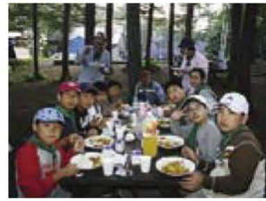
▲キャンプで食べるカレーは最高！

「夏だ！ キャンプだ☆自分さがし！」をテーマに、福島県磐梯の豊かな自然の中で、野外活動を通じて、子どもたちの自主性(生きる力)、協調性(友情)を大きくみます。 日程 8月3日(金)から5日(日)(2泊3日) 参加者事前説明会 7月15日(日) 湖北台東小学校体育館で行います。(必ず参加してください) 場所 国立磐梯青少年交流の家 対象・定員 市内在住の小学校4年生から中学生、先着90人 参加費 1万5000円