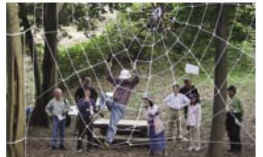
▲相島の森に巨大クモの巣出現！ (昨年の作品)