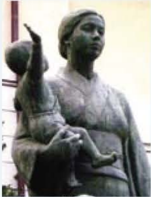
▲酸性雨の被害にあった銅像 (靖国神社の境内)

私たちが、今回、調べたテーマは「我孫子の酸性雨」についてです。 なぜ、このテーマを調べようと思ったかというと、今、世界各地で起きている「酸性雨」は、我孫子にも降っているのか、疑問に思ったからです。 もともと雨は弱い酸性なのですが、pH5.5以下になると強い酸性を示し、土や植物などに悪影響を与えます。この雨のことを「酸性雨」と呼びます。酸性雨が降ると、木や植物が