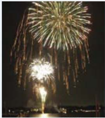
▲尾をひいて広がる「菊物」の花火(手賀沼花火大会)

夏といえば何を思い浮かべますか？花火を思い浮かべる人も多いと思います。我孫子市も毎年、柏市と合同で手賀沼花火大会を行っています。ですが、花火がどのようにして作られているのかなどはあまり知られていません。そこで私たちは花火について調べる事にしました。 花火の起源は、六世紀ごろの中国で敵陣に打ち込むなど、武器として使われていた物です。それが、十三世紀ごろにヨーロッパへ伝わり、王権を示す為やつめ、それをほり合わせれば完成です。この時の火薬の色やしきつめ方によって打ち上げた時の模様がかわります。普通の花火の丸い花火を「割物」といい、 中でも尾をひいて広がるものを「菊物」といいます。そして蝶や土星などの形の花火を「型物」といいます。その他にも、ナイアガラの滝などは「仕掛花火」、私達が手で持つてやる線香花火などは「おもちゃ花火」と名前が付いています。 今年の手賀沼花火大会は、八月十八日に行われます。一万四千発の花火に華やかに彩られる夜空に、それを水面に映す手賀沼。そんな夏ならではの光景を見に、足を運んでみてはいかがでしょうか。 ◎編集後記 今まではただ見て「きれいな」と思うだけの花火でしたが、今回花火について知ることができました。調べてうちに今年の花火大会が待ちどおしくなってきたりして、これから今以上に花火が楽しめそうです。