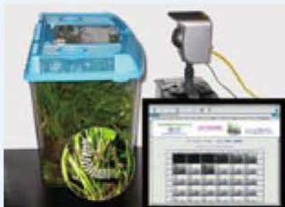
▲身近な生き物の様子をライブで公開

この幼虫の成長の様子を、昨年シジュウカラの子育てを観察した巣箱カメラを応用したのを使い、鳥博ホームページ( http://www.bird-mus.abiko.chiba.jp )上にライブで公開しています。