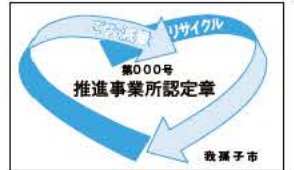
▲推進事業所認定章

「ごみ減量・リサイクル推進事業所認定制度」は、ごみの減量やリサイクルを推進している店舗などを市が認定し、広報などでお知らせして消費者の利用を促進することにより、資源循環型社会の実現をめざすものです。現在認定されている事業所は、下表のとおりです。 ※認定事業所の要件や申し込み方法など、詳しくはクリーンセンター☎7187-0015へお問い合わせください。