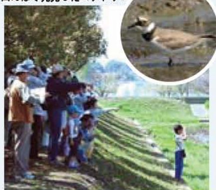
▲「てがたん」では、毎回、新たな発見が...

鳥の博物館では、4年前から、毎月第2土曜日、鳥をはじめ博物館周辺の生き物たちを観察する手賀沼定例探鳥会「てがたん」を行っています。