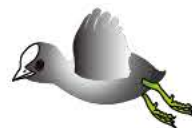
鳥の博物館 ☎ 7185-2212

鳥の博物館では、夏休み期間中、「遊んで、学べる」さまざまなメニューを用意しています。「親子で遊びたい」という方、「夏休みの自由研究をどうしようか」と迷っている小中学生のみなさん、みんな鳥博に来て解決しましょう。2階の企画展示室では、「てがたん〜手賀沼フィールドミュージアムへの誘い〜」展を開催中です。3階の展望テラスからは、手賀沼の景観が一望できます。日々の散歩を楽しむヒントが満載です。