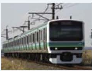
▲水空ライン成田線