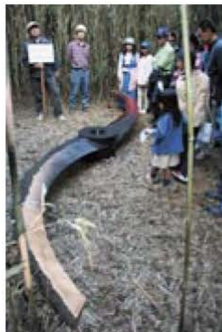
▲奥深く篠竹の世界に佇む作品