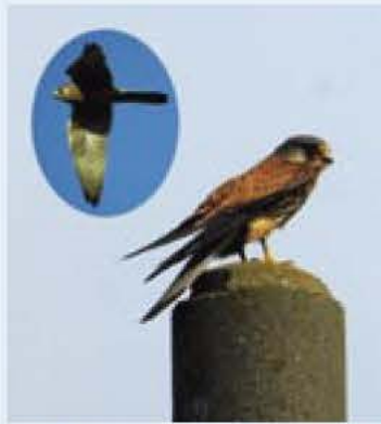
文 村松和行(鳥の博物館嘱託学芸員)

秋、稲刈り後の水田や畑の杭の上に、ハトくらい大きさのスマートなシルエットの猛禽類を見かけることがあります。チョウゲンボウです。チョウゲンボウは、ハヤブサの仲間です。1年を通じて見られる留鳥です。日本全体で見ると、北海道から中部地方で子育てをし、冬になると日本各地で見られる鳥です。巢は、