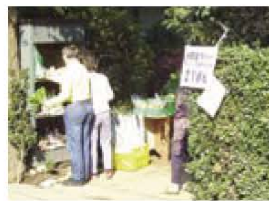
▲昨年のお野菜ラリーの様子

日時 11月3日(祝)(雨天実施) 場所 あびこ農産物直売所(我孫子新田22の4) ◎農産物共進会(品評会) 市内の農家の方が丹精込めて栽培した農産物が多数出品。出品された農産物販売は午後2時から ◎プレゼント付きゲーム 共進会で、投票いただいた方は景品が当たるゲームに参加できます。午前10時30分から正午 ◎野菜づくり相談コーナー 農業のプロによる農産物栽培相談は午前10時30分から午後3時 ◎特設コーナー 焼き芋、ヨーヨー釣りなどの露店販売、喫茶コーナーほか 主催 我孫子市農業青年会議所、あびこ農産物直売所出荷組合 ※当日直売所でお買い上げいただいた方には、1000円ごとに100円の割引券を進呈。 ◎農政課・内線510