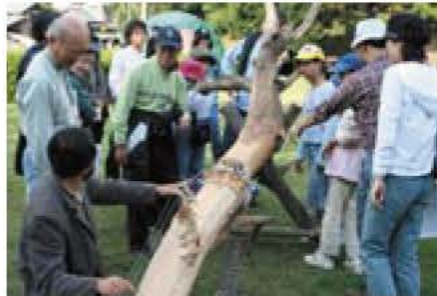
▲昨年の人気投票 No.1 の音の出る楽しい作品