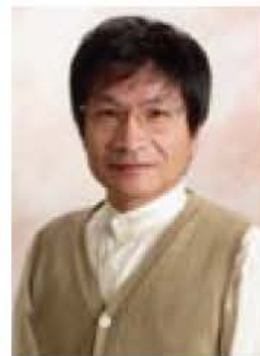
生活支援課・内線377

※手話通訳あり。 主催 我孫子市、我孫子市教育委員会(協賛…柏人権啓発活動地域ネットワーク協議会) 申し込み 不要。 当日直接会場へ