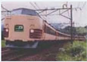
▲エアポート常磐号のイメージ写真提供...JR東日本東京支社

JR東日本東京支社は11月21日に、年末年始に常磐沿線から成田空港へ乗り換えなしで行ける快速「エアポート常磐」を運行すると発表しました。都心から常磐線・成田線を経由して成田空港へ直通運行する列車ははじめてのことです。