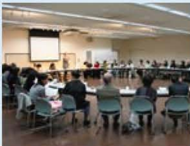
▲外国人を対象に市職員が説明

12月、市民プラザとアピスタで、市国際交流協会(AIRA)の日本語教室に通う19カ国約50人の方を対象に、地震災害などについての講座が行われました。講座では、阪神淡路大震災などの地震災害のビデオを見た後、大地震から身を守るために、家の中の整理整頓や水・食料の備蓄、トイレ用品の準備など、日ごろからの備えと工夫について学びました。