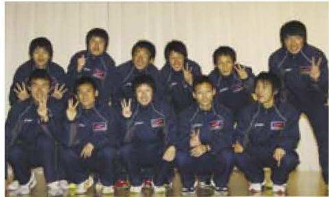
▲慰労会で3位のピース!