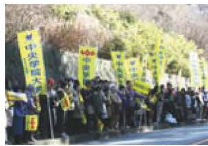
▲箱根で応援するスポーツ振興応援団

応援団は、全国レベルで活躍する市内のスポーツチームを、多くの市民と応援しスポーツの振興と活気ある街づくりを目的に平成17年10月に発足しました。