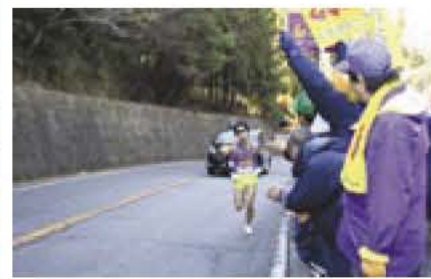
▲往路5区で選手を応援する星野市長

星野市長(応援団名誉会長)は、我孫子市スポーツ振興応援団の応援バスツアー(バス4台162人)に参加し、往路のスタートとゴール(写真)付近で選手に大きな声援を送りました。星野市長は「チーム一丸となつて襷をつなぐ姿に感動しました」