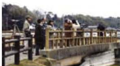
▲どんな鳥と出会えるかな

我孫子市環境レンジャー、我孫子野鳥を守る会の皆さんが、手賀沼遊歩道を歩いて手賀沼周辺に集まる冬の鳥を案内します。1月は手賀沼周辺では最も多く野鳥が観察できます。昨年49種の鳥が観察されました。