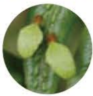
▲「コモチシダ」の不定芽(無性芽)

十月ごろ、船戸地区を訪れると、日当たりのよい南側斜面にコモチシダが生育しており、垂らした葉の表面に小さな葉状の芽をたくさんつけていました。