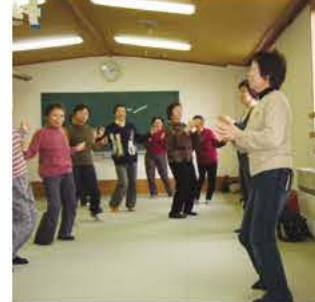
健康づくりや食生活改善のアドバイザーとして、活動をしてみませんか。

募集期限1月30日(水) 選考日2月13日(水) 募集科目①NC機械加工科、②造園科(いずれも1年コース) 対高等学校卒業程度以上①16人、②8人 選考方法学科試験(国語・数学)、適性検査、面接 申・☎写真と入校選考料(県証紙2200円)を貼付した指定の願書に必要事項を明記し、県立我孫子高等学校専門科(久寺家684の1) ☎7184・6411へ提出 ※雇用保険受給者(予定者)は住所地の職業安定所へ提出してください。