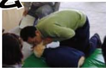
▲救命講習会での実習風景

消防署では、バイスタンダー（その場に居合わせた応急処置のできる人）を育成するため、普通救命講習会を開催します。 AED（自動体外式除細動器）の使用方も学びます。 ※心肺停止者の心臓に電気ショックを与え、正常な状態に戻す医療器具。 日時・場所 2月17日(日)午前9時から正午、消防本部2階大会議室（参加無料） 内容 心肺蘇生法、止血法、AEDの操作方法などの習得 対象・定員 市内在住・在学・在勤で健康な方、先着25人 ※救命技能適正と認められた方には、講習後に修了証を交付。 申し込み・問い合わせ 2月1日から、（土・日曜を除く）午前9時から午後5時）直接または電話で消防本部警防課 ☎7181・7701へ