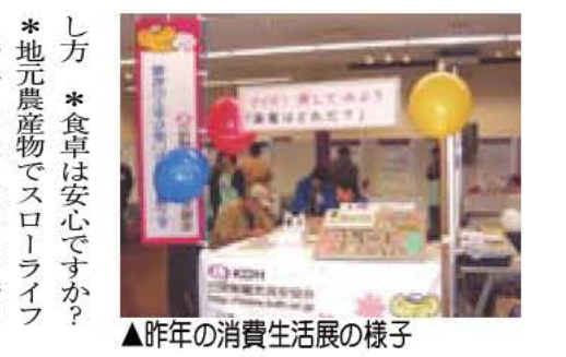
▲昨年の消費生活展の様子

第32回 消費生活展 あなたも今からスローライフ 生活の安全・安心（食や環境問題）を一緒に考えましょう。 日時 2月9日(土)・10日(日)午前10時30分から午後4時30分 場所 市民プラザ（入場無料） 内容 ◎「子どもコーナー」、*住宅相談コーナー、*ワンポイント講習など *アンケート回答で「あびこ農産物」などのプレゼント（両日とも先着400人） ◎スタンプリーパー参加で「石けん」のプレゼント（両日とも先着400人）