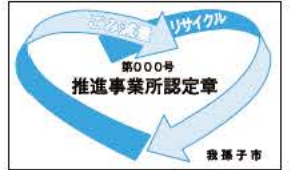
▲推進事業所認定章

「ごみ減量・リサイクル推進事業所認定制度」は、ごみの減量やリサイクルを推進している店舗などを市が認定し、広報などでお知らせして消費者の利用を促進することにより、資源循環型社会の実現をめざすものです。現在認定されている事業所は、下表のとおりです。 ※認定事業所の要件や申し込み方法など、詳しくはクリーンセンター ☎7187-0015 へお問い合わせください。