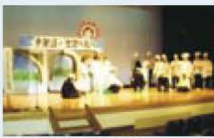
▲昨年の寸劇の様子

日時 2月17日(日)午前9時 30分から午後3時30分 場所 湖北地区公民館 内容 各学年の寸劇・クラブ・同窓生の発表と作品展示 入場料 無料 ※駐車場は限りがあります。公共交通機関をご利用ください。 ☎ 湖北地区公民館 ☎7188-4433