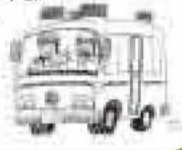
あびバス(栄・泉・並木ルート)時刻表