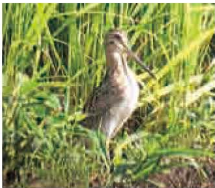
文 寺田 夏芽（鳥の博物館囀託学芸員）

オオジシギは、越冬地のオーストラリア南東部から繁殖のため日本に飛来する渡り鳥です。子育ては、おもに本州中部の高原、東北や北海道の平地の草地で行います。我孫子周辺では春と秋、渡りの途中、田んぼに立ち寄り餌を採る姿が見られます。大きさはハトぐらい、くちばしとあしが長く、全体的に茶色で、背景に見事にとけ込む羽色です。餌は、泥の中の昆虫の幼虫やミミズなどで、長く