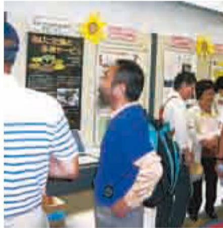
▲展示パネルを前に、団体と交流する来場者

第4回の今回は、70歳で退官後、自治会長など積極的に地域活動されている山口繁さん(元最高裁判所長官・市内若松在)の講演会や、交流・懇親会を行います。まもなく定年の方、定年後の充電を終えられた方もふるってご参加ください。ご夫婦おそろいでも大歓迎です。また、活力あるシニアの方々との出会いを期待されている市内の各団体も、多数ご参加ください。 ※団体の参加は、事前に申し込