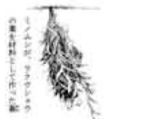
文・写真 佐久間 俊行

八月下旬に、手賀沼公園を訪れると、水辺の広場に植えられたラクウショウが、サッカーボールのような果実(球果)をたくさんつけていました。落羽松の葉は、小枝に多数並んでつき、鳥の羽のような形に見えます。秋には色づき、