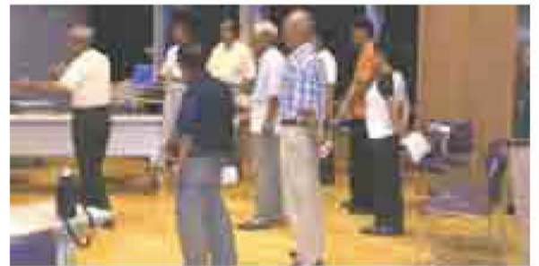
▲コメディイ劇「明日に向かってボランシカ」の練習風景

協議会、我孫子市) 市民活動支援課 ☎7185-1467 ic-support@kind.ocn.ne.jp