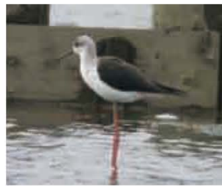
写真 尾崎 光代(鳥の博物館友の会) 文 斉藤 安行(鳥の博物館学芸員)

今年の9月3日、鳥の博物館友の会の方が「市民農園前沼の手賀沼にセイタカシギがいるよ!」と教えてくれました。10羽のセイタカシギが、手賀沼の植生浄化用の人工島に降りていました。全長(※1)約40cmの胴体に、30cm程のすわりとのびたピンク色の脚。貴婦人のような姿です。細長い嘴で水辺の小動物を捕らえて食べます。日本の留鳥として定着したのは、1975年に愛知県で初めて繁殖が確認されて以来のことです。その後、各地で観察される機会が増えましたが、決して数多い鳥ではありません。手賀沼周辺では1977年から観察記録があります(※2)。セイタカシギは、世界中の低・中緯度地域の水辺に分布しています。日本にこれまで生息していなかったのが不思議なくらいです。この鳥が安心して定着できるような水辺環境はどこにあるのか? 今後の動向が気になる「身近になった」鳥の一つです。 ※1 全長(鳥を仰向けに寝かせた時の、嘴の先から尾羽の先までの長さ) ※2 我孫子野鳥を守る会による記録