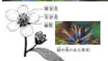
文・写真 佐久間 俊行

この草は幕末に渡来した帰化植物で、姿はコセンダンクサによく似ています。コセンダンクサの頭花は筒状花ですが、シロノセン