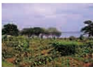
▲高野山ふれあい市民農園

市民農園は市内に2カ所、市民の皆さんが土や緑と触れ合える場所として、我孫子市が運営しています。高野山ふれあい市民農園