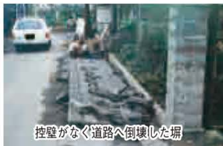
控壁がなく道路へ倒壊した塀

など、暮らしを守る役割を果たしますが、地震時には倒壊するなど私たちの命を脅かす危険なものになる場合があります。不特定多数の人たちが通行する道路、通学路、避難路などの道路に面するブロック塀は特にその安全確保が所有者に求められます。 塀の設置や補強は建築士などの専門業者に相談し、法に定められた基準を守りましょう。 ☎住宅課・内線526