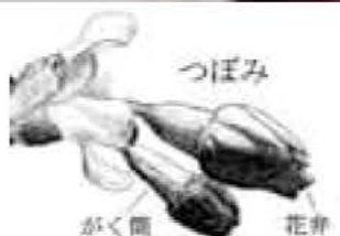
文・写真 佐久間 俊行

二月の下旬に泉地区を訪れると、人家の庭に植えられたカワヅザクラが満開でした。カワヅザクラはカンヒザクラを片親とする園芸品種で、原木は野生の状態で見られるといわれています。現在は伊豆半島南部の河津町や石廊崎などに植えられ、花の名所となっ