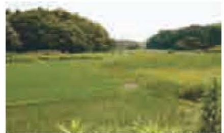
▲緑豊かな岡発戸・都部の谷津

住宅都市としての魅力を高めるためには、手賀沼や古利根沼などの自然豊かな水辺を多くの人々が何度も訪れたいくなるような交流空間としていくことが必要です。今後も、手賀沼の浄化や古利根沼の整備、谷津ミュージアムづくりなど、我孫子ならではの貴重な自然の保全・再生に取り組めます。 また、環境に負荷を与えない暮らしの実現を目指し、引き続き、ごみの排出抑制、生ごみの資源化、剪定枝木のチップ化や太陽光発電システムの利用などを進めます。