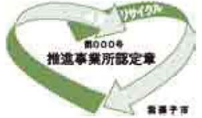
▲推進事業所認定章

「ごみ減量・リサイクル推進事業所認定制度」は、ごみの減量やリサイクルを推進している店舗などを市が認定し、広報などで広く市民の皆さんにお知らせして消費者の利用を促進することにより、資源循環型社会の実現を目指すものです。現在認定されている事業所は下表のとおりです。 ※認定事業所の要件や手続きなど、詳しくはクリーンセンター☎7187-0015へお問い合わせください。