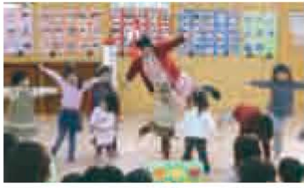
▲1月にオープンした「ここここ広場」

新年度は、「子ども部」を創設して、子ども施策の一元化を図り、子ども施策を総合的に推進できるようにします。