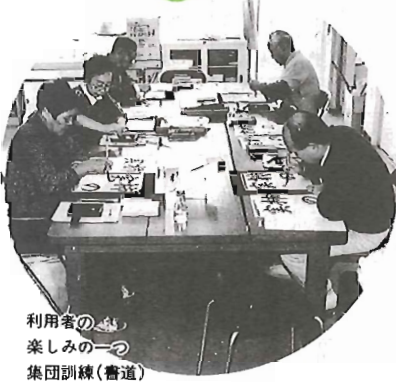
利用者の楽しみの一つ 集団訓練(書道)