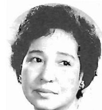
ゲスト・渡辺はま子

手賀沼りに伝わる民俗芸能と日本古来の伝統的な笛・太鼓によるおはやしの競演。今回は市制20周年記念事業として内容もいっそう充実。ゲストは歌手の渡辺はま子さん。ご家族おそろいでお楽しみください。 =問い合わせ=社会教育課☎(85)1151