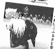
▲あびこふるさと会