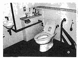
4 身障者用のトイレ

して、スロープを設ける、また、視覚障害者のための誘導点字ブロックを敷設するなどとなっております。 これらのことは、施設設置等の理解と協力が不可欠です。また、施設面だけでなく、みなさん一人ひとりの温かい思いやりや援助の手も必要です。 「福祉のまちづくり」に向けて、皆様の積極的な参加とご協力をお願いいたします。