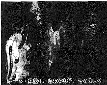
「アーム・仲良く、おしゃべりに、広くほしく」

▼日時 8月4日(土)5日(日) (1泊2日) ▼場所 栃木県塩谷町東直屋キャンプ場 ▼対象 市内の小学4、5、6年生及び中学生 ▼定員 90名(先着順) ▼参加費 1人6500円 ▼申し込み・問い合わせ先 ハダキに 参加者の住所、氏名、性別、電話番号、学校名、学年、保護者名を明記し、6月20日(水)までに我孫子1684教育委員会社会教育課青少年係(85-1151)へ (詳しいことは、後日応募者へ連絡します)