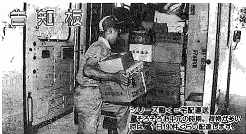
テレビ番組の収録現場。収録中は音声の調節や、字幕の打ち込みなどを行います。

平成2年6月1日現在 (対前年比) ●市役所本庁 85-1111 ●つくし野支所 84-8801 ●湖北支所 88-0328 ●湖北支所 88-2111 ●市佐支所 89-2358 ●教育委員会 85-1151 ●水道局 84-0111 ●消防署 84-0119 ●少年センター 84-1900 ●保健センター 87-1131 ●市民会館 84-3311 ●中央公民館 82-0515 ●鳥の博物館 85-2212 ●市民体育館 87-1155 ●市民図書館本館 84-1110 ●湖北台分館 87-3055 ●布佐分館 89-1311 ●移動図書館 87-0909 ●都市改造事務所 85-1171 ●身体障害者福祉センター 88-0141 ●あらかき園 88-4188 ●つつし荘 88-0123 ●生活環境課(浄化槽) 87-2379 ●(ゴミ) 87-0015 (し尿) 88-2547 ●布佐南隣センター 89-3740 ●天王台北隣センター 82-9988 ●湖北台市民センター 88-9927 ●布佐市民センター 89-1193