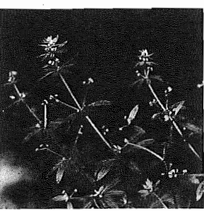
ヤエムグラ (あかね科)

健康の維持増進のためには、速足歩きやジョギングをされている方は多いようです。足は歩くための道具だけでなく、感覚器官でもあります。足にある神経は全て腰に集まり、更に脳へ伝えられれば腰痛だけでなく、頭痛、イライラ、血圧上昇など、体全体に悪影響を及ぼします。そのため、足を保護する靴選びを重視する必要があります。靴ははいてみて、歩いてみてはきやすさを第一に選びましょう。最近、注目されている足の病気が、親指を外側に曲つていく、付け根の骨が下向きに折れ曲つたまま元に戻らない「ハマー指」爪の両端の肉の中に食い込む「嵌爪」などがあります。たかが足のことと思わず、早目に専門医にみせ、適切な手を当てもらうことが大切です。靴には外反母趾用などのものも売られていますが、外から矯正後は、靴も靴下も脱ぎ捨て、足首や指を回して足の力を押し戻しましょう。足は体全体の健康のもと、特にこれからの方がうっとうしい時期にならないよう気を付けて、楽しく歩きましょう。(民生生協)