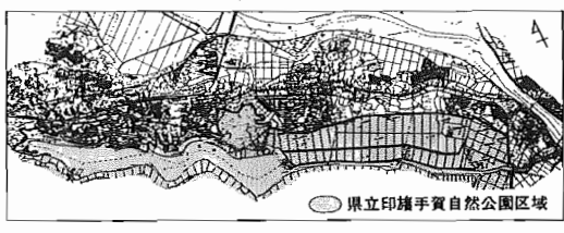
県立印旛手賀自然公園区域

自然は豊かな人間生活を築くうえで、わたしたちの心やすらぎを支え、また、レクリエーションの場を提供するなど、限らない恩恵を与えてくれます。このように自然を保護し、後世に引き継ぐために自然公園制度が設けられています。手賀沼周辺は、県立印旛手賀自然公園(下図参照)に指定され、次に掲げる行為などについては届出等が必要で、*工作物の新築、改築または増築 *広告物等の掲出、設置または表示 *土地の形状変更など 詳細については市公園緑地課、東葛飾土木事務所管理課電話0473-645136、県自然保護課電話0472-232056へ