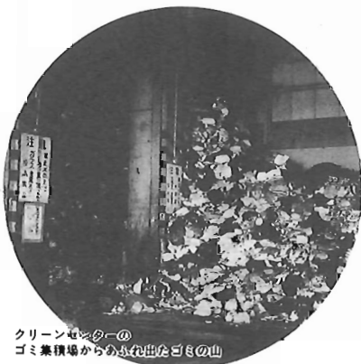
クリーンセンターのゴミ集積場からのもみ出たゴミの山

「ゴミは毎日の生活の中で、無くてはならないものです。しかし、いかに次第にゴミを減らすかは、重要です。例えば、「ゴミを5割減らす」といって、きれいに正しく分別して、リサイクルに変わらせないか。正しく分別して、リサイクルの減量や再資源化にもつながります。ゴミ、大きな社会問題の一つとなつて、いま「リサイクル」でももう一度考えてみませんか。生活環境課(87)0005