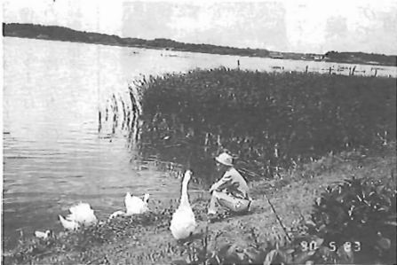
《私の好きな場所》手賀沼遊歩道一余田岸(湖北台)「白鳥親子にバンクスを与えている人が印象的でした」

写真募集 この欄に載せる写真を募集します。テーマは、私の好きな場所、この風景(別紙に住所、氏名、電話番号、撮影年月、場所、ひと言を明記し、我孫子1-858市役所広報課(電話)へどうぞ (柳道星)