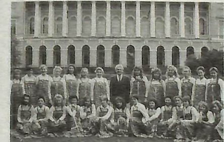
▲2度目のコンサートを行うレニングレード少年少女合唱団のみなさん