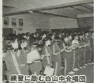
練習に励む白山中合唱団

ロシアに生まれた世界最高の「レニングレード少年少女合唱団」が、市民会館で2度目のコンサートを開催します。 公演では、白山中学校合唱団の生徒たちが賛助出演し、レニングレード少年少女合唱団と合同合唱を行います。 白山中学校では、世界的な合唱団を迎えるのコンサートを楽しむに、放課後などを利用して、毎日猛練習に励んでいます。 当日は、世界的な合唱団と白山中学校合唱団の皆さんとの美しいハーモニーの共演をぜひ、お楽しみください。 ▼問い合わせ 教育委員会社会教育課 ☎(85)1151