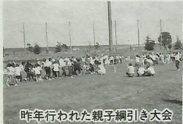
昨年行われた親子綱引き大会

恒例の「市民体力づくり大会」は、10月10日(祝)、市民体育館野球場で行われます。スポーツをするには絶好の季節となりました。ふだんスポーツから遠ざかっている人や友だち同士、ご家族連れでさわやかな汗を流してみませんか。