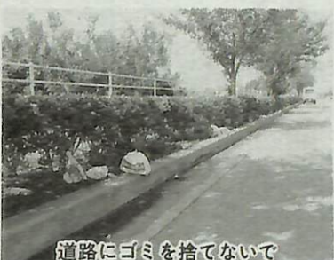
道路にゴミを捨てないで

平成元年4月に開通した都市計画道路(根戸新田布佐下線)の手賀沼公園から北柏方面に通じる道路の両側には、空き缶やビニール袋が捨てられ手賀沼周辺の景観を損ねています。 歩道沿いには四季折々のさくらやツツジが植えられ、私たちの目を楽しませてくれる一方、最近、悪質な「ゴミのポイ捨て」が目立っています。 市では、道路沿いに「STOPゴミ」の看板を設置し、ドライバーに呼びかけたり、手賀沼周辺のゴミ清掃を市民ぐるみで行うなど、環境美化にも積極的に取り組んでいます。道路はゴミ捨て場ではありません。皆さん一人ひとりがマナーを守り、環境美化にご協力ください。