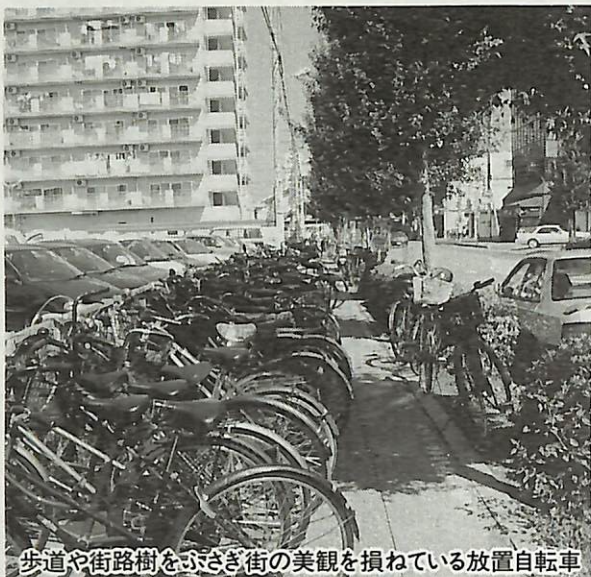
歩道や街路樹をふさぎ街の美観を損ねている放置自転車