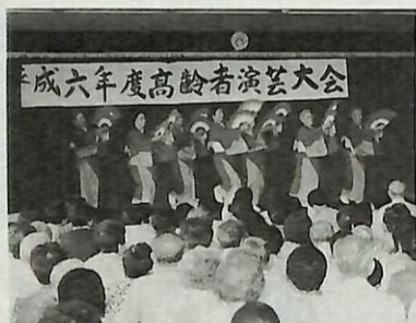
成六年度高齢者演芸大会

演し、民謡、舞踊、カラオケなど、日頃老人クラブや気の合う仲間同志で練習した成果を披露(写真)。会場に集った約350名の観客も一体となつて大きな拍手を送っていました。また17日には囲碁・将棋大会も行われ、参加した約80名が真剣な表情で熱戦を展開。 このほか、書道や手芸、絵画、写真、陶芸などの展示コーナーでは、プロ顔負けの秀作約90点が展示され、訪れた人の目を惹きつけていました。