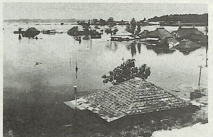
〈昭和13年手賀沼のはんらんで水没する布佐のまち〉

昔の思い出の写真から当時の手賀沼を振り返ってみませんか。(このシリーズは毎月1日号に掲載しています)