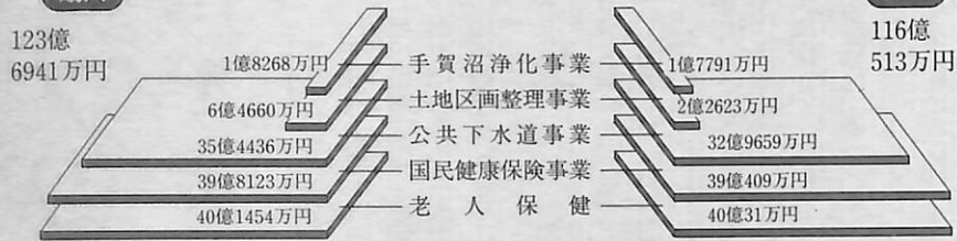
▼表5、平成6年度一般会計収支状況(上半期)