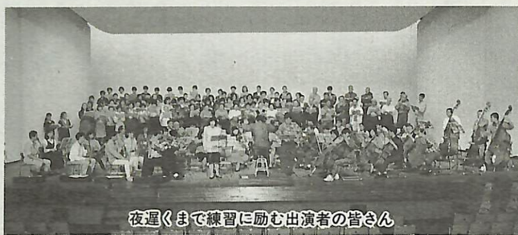
夜遅くまで練習に励む出演者の皆さん

今年で13回目となる市民コンサート。今回のテーマは「オペラ」。一流のソリストを迎え、有名なオペラのハイライト部分を、我孫子市民フィルハーモニー管弦楽団の演奏、我孫子合唱連盟会員と一般公募により集まった市民210名の合唱でおとけします。一人でも多くの方に、オペラの楽しさを感じていただくと企画した演奏会。皆さんのこの機会に、ぜひご家族でお出かけください。