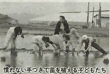
慣れない手つきで苗を植える子どもたち

子どもたちに稲作の楽しさや大変さを体験してもらおうと行っているもので今年で7回目。今回は赤米に加え、中国から取り寄せた紫米(血糯米)を約500平方メートルの広さで栽培。子どもたちは、初めは田んぼに入るのをためらいながらも、ふくらはぎまであるドロの中に入り、15分程度に育った苗を丁寧に植え、時折カエルを見つけては歓声を上げていました。紫米は順調にいけば9月に、赤米は11月に、それぞれ収穫される予定です。