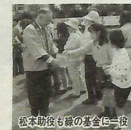
松本助役も緑の基金に

4月29日・30日の両日、第11回「植木まつり」が、手賀沼公園多目的広場で行われ、市民の皆さんと一緒に自然保護や緑化の推進に努めていきたい」とあいさつ。イベント日は、天候にも恵まれ、「いちいちどうぶつ村」では、子どもたちがシナガチヨウ、アヒル、リスなどの動物とふれあったり、スパーホルズくいや緑のクイズなど多彩な催しに、両日大勢の家族連れでにぎわっていました。なお、期間中、緑の基金には13万4208円の善意が寄せられました。