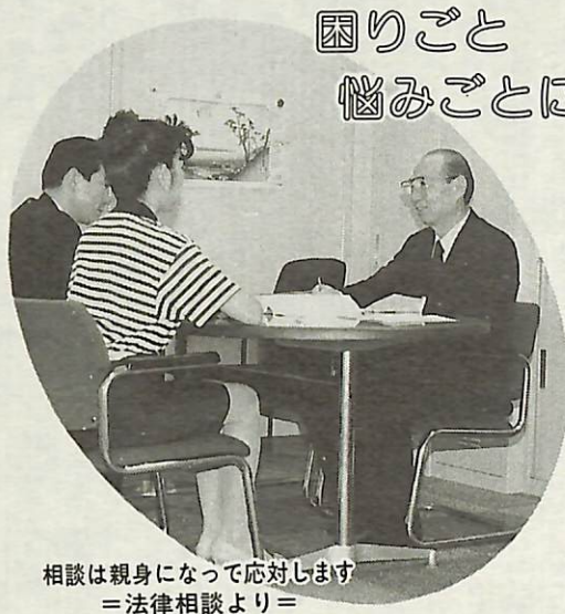
相談は親身になって対応します ＝法律相談より＝