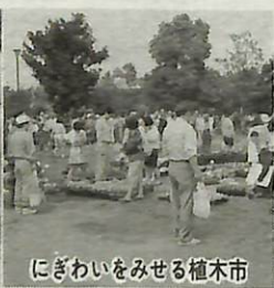
にぎわいをみせる植木市