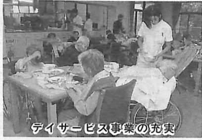
デイサービス事業の充実

さらに、市民団体が痴呆性高齢者のために独自に行うデイホーム・グループホームに対して助成を行います。 「敬老祝金・敬老祝品の見直し」 限られた財源でより効果