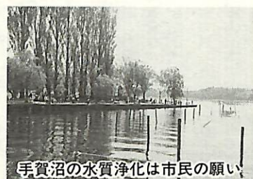
手賀沼の水質浄化は市民の願い

「ボイ捨てや犬のふん公害防止条例」空き缶等の散乱や犬のふん害は不衛生で、まちの美観を損なうものです。平成9年度に、市の現状に沿った条例案を策定します。