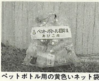
ペットボトル用の黄色いネット袋

今日から、ペットボトルの資源回収が始まります。資源回収の日には、最寄りの資源回収ステーションに、ペットボトルの指定回収袋として新たに「黄色のネット袋（写真・上）」が置かれます。「混ぜればゴミ、分ければ資源」になります。皆さんのご協力をお願いします。