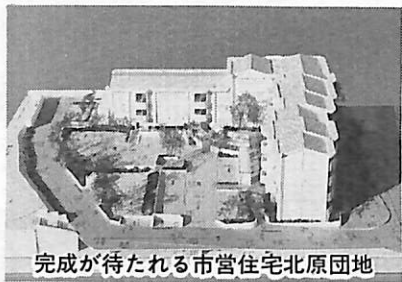
完成が待たれる市営住宅北原団地

「中心拠点整備構想」 平成9年度は、我孫子駅前拠点と手賀沼拠点の2つの地区の具体的な施設配置の検討を行い、事業年度も明らかにした計画を策定します。 「成田線部分複線化事業」