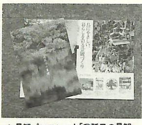
▲景観パンフレット「我孫子の景観」