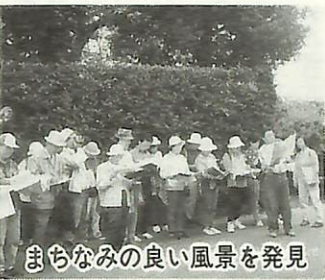
まちなみの良い風景を発見

た風景写真コンテストでは、市民の皆さんによって紹介された美しい風景は、百年前の手賀沼八勝とほぼ同じ景色でした。やはり、手賀沼、利根川、富士山、筑波山などであり、下総の丘陵と谷津がおりなす青空と緑豊かな田園風景です。人々が好んで選ぶ美しい風景は、この一世紀間の近代化の荒波にもまれながらも、やはり変わらなかったのです。我孫子の美しい景観を大切にしたいものです。