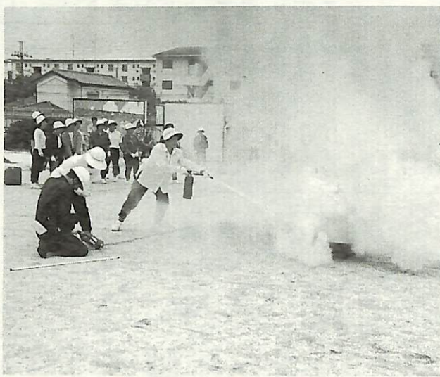
昨年の防災訓練(婦人防火クラブによる初期消火訓練)

市では、総合防災訓練を「防災の日」の9月1日(月)に実施します。訓練は「大規模震災初動体制計画」で定める6地域支部のうち、我孫子北部・南部の2つの地域で実施します。地震はいつ起きるかわかりません。いざという時に備え、この訓練に積極的に参加ください。