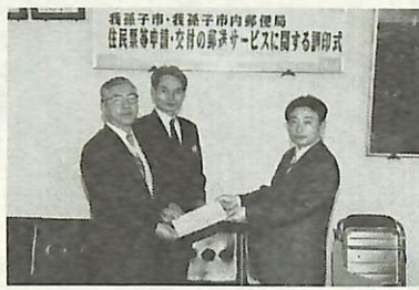
▲郵便局との調印式(11月25日)