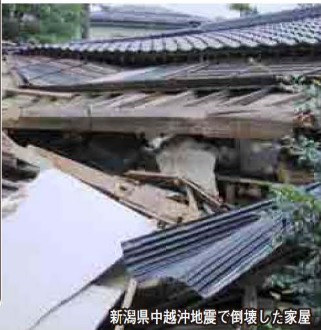
新潟県中越沖地震で倒壊した家屋