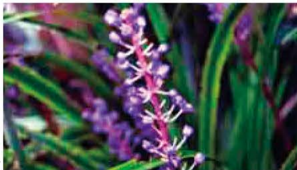
文・写真 佐久間 俊行

十月の半ばに我孫子地区の人家で、ファイリヤブランが紫色の花穂を立てているのを見かけました。ヤブランという名は、藪に生え、葉がランに似ているというのでつけられた名です。ヤブランは常緑の多年草で、細長いつやのある葉を持っています。ファイリヤ 十月の半ばに我孫子地区の人家で、ファイリヤブランが紫色の花穂を立てているのを見かけました。ヤブランという名は、藪に生え、葉がランに似ているというのでつけられた名です。ヤブランは常緑の多年草で、細長いつやのある葉を持っています。ファイリヤ