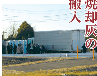
▲焼却灰の搬入車両

千葉県は、昨年12月20日、「松戸市、柏市、流山市の焼却灰の一時保管施設への搬入を開始する」と報道発表しました。