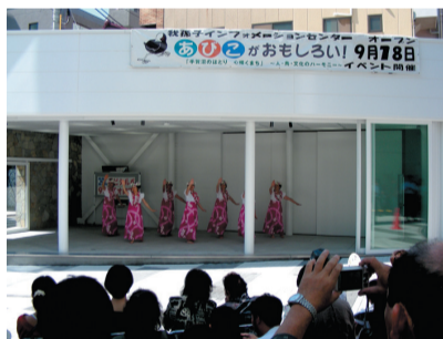
▲アビシルベステージでダンス

展示室を野外イベントステージとして活用することができます。ブラスバンド演奏やダンス、伝統芸能などジャンルは問いません。我孫子駅前のアビシルベステージで日ごろの練習の成果を披露してみませんか。