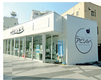
▲我孫子インフォメーションセンター「アビシルベ」

のチラシなどたくさん情報を取り揃えています。住んでいても知らないこと、近くにいるけれどわからないことが意外にたくさんあります。アビシルベで新たな発見をしてください。