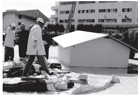
▲平成22年度総合防災訓練の様子

総合防災訓練は、茨城県南部を震源域とする地震が発生し、市内で甚大な被害が発生していることを想定して実施します。地域の皆さんや関係機関などと連携