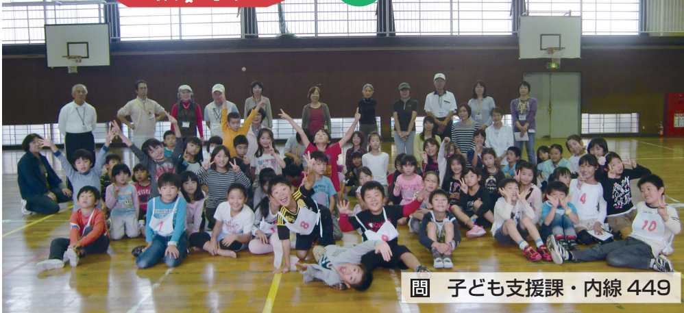
図 子ども支援課・内線 449

市では、若い世代の就労と育児の両立支援策として、保育園や学童保育室の待機ゼロを堅持しています。また、小学生が放課後や土曜日に安心して過ごすことができる居場所づくりとしての「あびっ子クラブ」も設置しています。