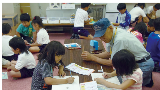
▲宿題もサポーターさんがいてくれると安心

サポーターが支援してくれます。外遊びは、学童保育と同じ時間に活動するなど、より多くのスタッフが子どもたちを見られるよう工夫されています。