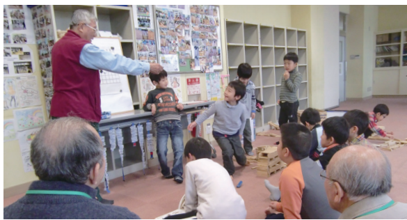
▲みんなで囲碁のルールをお勉強中

「あびっ子クラブ」では、保護者をはじめ地域の方市では、若い世代の就労と育児の両立支援策として、保育園や学童保育室の待機ゼロを堅持しています。また、小学生が放課後や土曜日に安心して過ごすことができる居場所づくりとしての「あびっ子クラブ」も設置しています。市内5校の小学校で開設されていますが、平成26年度には、新たに並木小学校と布佐南小学校にも開設する予定です。今後とも条件が整ったところから順次開設していきたいと考えています。こうした事業を通じて、子どもたちがのびのびと心豊かに育つまちづくりをめざしていきます。