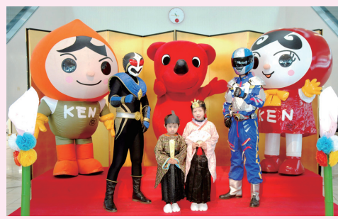
▲昨年の撮影の様子

の衣装を着て、チーバくん、手賀沼のうなぎちゃんと一緒に写真を撮ろう。参加されたお子さんに、手賀沼のうなぎちゃん缶バッジをプレゼント。 ※撮影時、お内裏様・お雛様の衣装をお貸しします。 対象・定員 3歳~12歳のお子さん、先着28組(要申込) 費用 無料 ☎・☎ アビシルベ ☎71001014(午前9時~午後6時、金・土曜・休前日は午後8時まで)