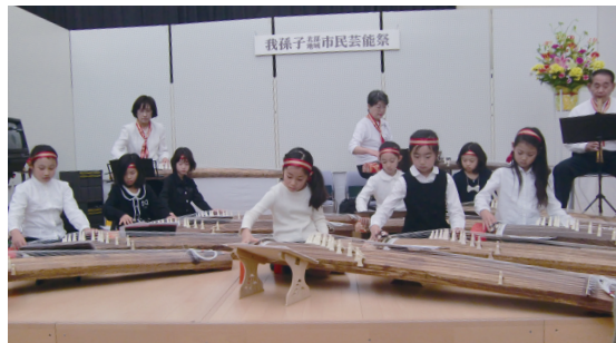
▲北部地域文化祭でチャレンジタイムの成果を発表