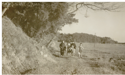
▲寿下ハケの道（昭和37年）

市民の皆さんが選んだ「我孫子のいろいろ八景」其の二を音楽・映像とともに発表します。「新しい我孫子の魅力」をお楽しみください。ご来場の皆さんにガイドブック「我孫子のいろいろ八景見聞綴り 其の二」を配布します。