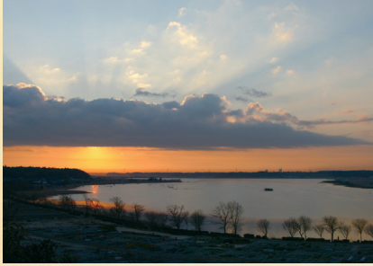
▲ゼロポイントから

そして、もう一つの顔、それは「ゼロポイント」。アマチュアカメラマンのあいだでは、長いこと、この愛称で親しまれてきたことをご存じでしょうか。広い手賀沼を見渡せるこの台地の先端部は、絶好の撮影ポイントとして知られ、幾百もの目がレンズを通して手賀沼を見てきたその場所なのです。夜明けの手賀沼を眼下に望めば、時代を超えて「手賀の海」を感じることができます。