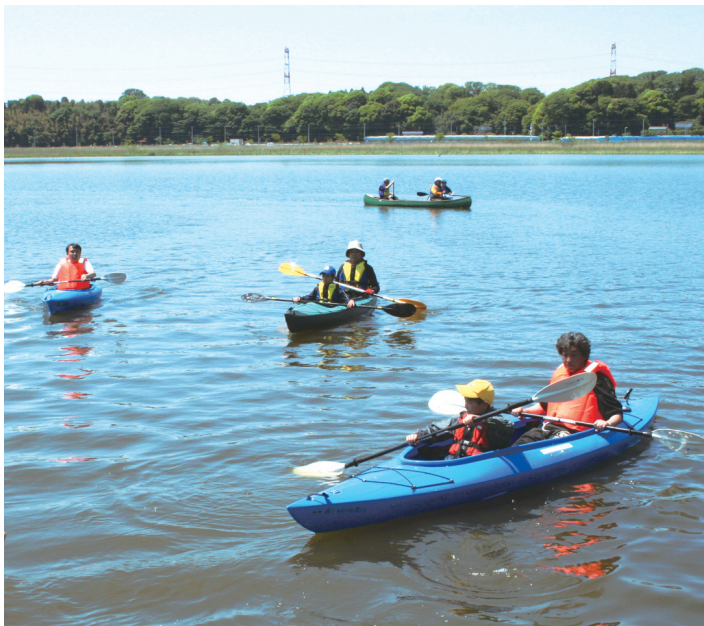
▲春の手賀沼でカヌー体験を楽しむ人々

Enjoy手賀沼!は、一人ひとりがふるさと手賀沼とのかかわりを感じながら楽しく一日を過ごすというイベントです。楽しい企画をたくさん用意して皆さんをお待ちしています。