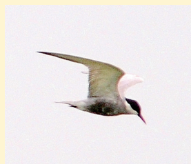
文 村松 和行(鳥の博物館学芸員)

アジサシの仲間、魚のアジを尖ったくちばしで刺して捕まえることが名前の由来といわれるほど、古くから水辺の鳥として知られています。手賀沼では夏に飛来するコアジサシが主に見られますが、近年、かつて観察例が少なかったクロハラアジサシの姿も見られています。