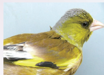
▲カムチャツカで捕獲した亜種オオカワラヒワ