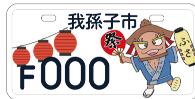
ふさだだしおのナンバー

持ち物 ○既存ナンバーからの交換…ナンバープレート・標識交付証明書・本人確認書類(免許証など)・認印 ○新規登録…販売証明書(譲渡証明書と廃車証明書)・本人確認書類(免許証など)・認印 費用 無料 その他 ○代理人による申請の場合は、委任者本人自筆の委任状が必要になります。○ナンバーの変更に伴い、自賠責保険等の変更手続きが必要となる場合があります。詳しくはご加入の保険会社にお問い合わせください。 問 課税課・内線403