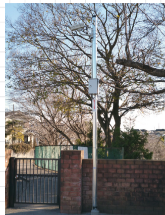
▲防犯カメラ(我孫子第一小学校)

市では、子どもたちが安全で安心して通学できる環境整備として、公立保育園(5園)、小・中学校(19校)に防犯カメラを設置しました。個人のプライバシーの保護に配慮しながら、施設の主な通用門と公道が撮影できるように設置しています。画像は24時間撮影し、録画装置に記録され7日間保存されます。