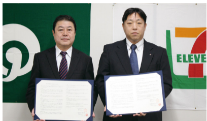
図 高齢者支援課・内線397

市では、現在18の民間事業所とこうした支援を必要としている方の早期発見に向けた協力体制を構築しています。今後も民間事業所との協力体制を広げていきます。