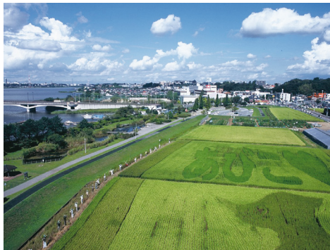
最優秀賞「夏雲湧く」▲