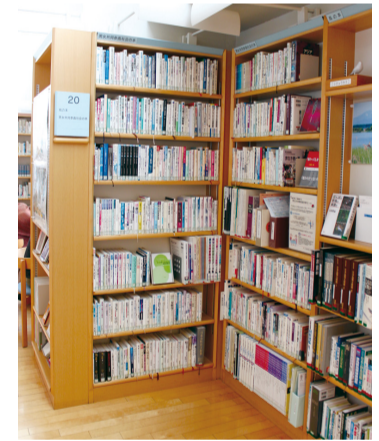
▲「男女共同参画社会の本」コーナー

図書館アビスタ本館に常設の「男女共同参画社会の本」コーナーがあるのを存じですか。女性の暮らしや生活に関するデータの本や、調べ学習に便利な新聞切り抜き雑誌などもあります。ぜひ手に取ってご覧ください。また今年度も9月と3月の発行に向け、情報紙「かがやく」を準備中です。カラー版でさまざまな特集を取り