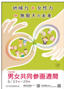
▲内閣府 平成27年度 男女共同参画週間ポスター

プレミアム商品券★応募方法については3面商品券が使える取扱店については我孫子市商工会およびホームページでお知らせしています。