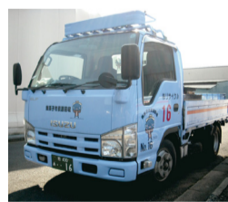
▲クリーンセンター回収車両

市の資源回収車は、全車青い車両で「我孫子市資源回収」と「手賀沼のうなぎさん」の表示があります。