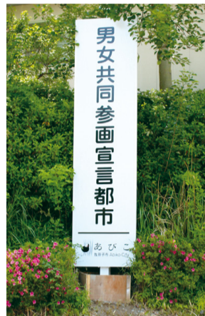
▲男女共同参画宣言都市看板

現を誓いました。その思いを次世代に伝えていくため、市庁舎に宣言都市の看板を設置し、独自に男女共同参画月間を定めました。今月は当