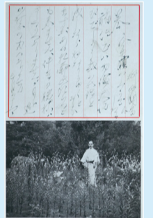
▲柳田國男からの絵葉書