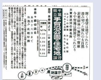
▲昭和13年2月14日『東京朝日新聞』より

昭和25年に東我孫子駅が開業すると、駅北口から常磐線に向けて一本の道ができました。次回は、その道を北に進んでみたいと思います。