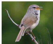
▲写真:中野久夫(我孫子野鳥を守る会)

日時・場所 10月10日(出)午後1時30分～2時15分(1時15分開場)鳥の博物館2階多目的ホール