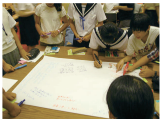
▲ヒロシマ青少年平和の集い