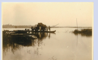
▲舟で車を運ぶ様子

みなさん、こんにちは。今回は、大利根橋付近を散策します。現在、青山から取手には橋を渡って簡単に行けますが、江戸時代は利根川を舟で渡っていたのをご存じですか。当時は青山と取手を通る水戸街道を結ぶために「渡し」が必要で、渡しは街道を通る人々にとって大切な交通手段であり、その運賃は地域の人々にとって収入源の一つでした。渡しは車が普及しても続きましたが、舟で車を渡すことは不便であったため地域住民から請願運動が起こりました。結局、国道6号が大利根橋によってつながったのは、昭和5(1930)年のことです。