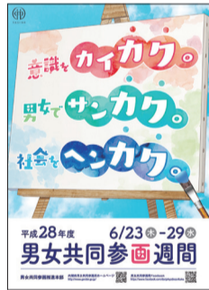
▲内閣府 平成28年度男女共同参画週間ポスター

毎年6月23日から29日は国の定める男女共同参画週間です。今年のキャッチフレーズは「意識をカイカク。男女でサンカク。社会をヘンカク。」今までの労働慣行や意識を変え、女性も男性も多様な働き方・暮らし方が可能な社会を目指そうという思いが込められています。