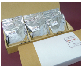
① 我孫子コーヒー物語

※各製造・販売店のほか、アビシルベ、あびこ農産物直売所あびこなどでも一部取り扱っています。