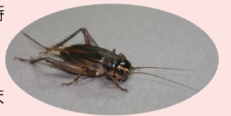
▲市内の草地に生息するエンマコオロギ

内容 バッタやコオロギの仲間は、暗くなるとそれぞれの声で歌いだします。博物館周辺の草地や林で採集したあと、虫の声に耳を澄ましてみましょう。身近な草地にはどんな虫が住んでいるのか、一緒に探してみましよう！