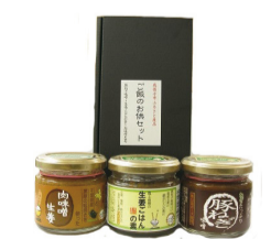
② ご飯のお供セット(3種)