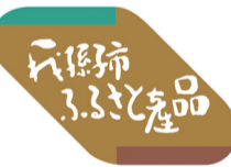
▲ふるさと産品表示ラベル