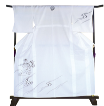
③ 市章入りカップ浴衣