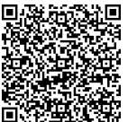
▲市ホームページ QRコード