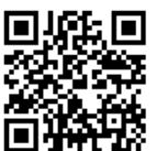
▲空メール用 QRコード

あった市のさまざまな保育サービスをご案内します。詳しくはお問い合わせください。 相談時間・場所 平日午前10時~午後3時30分、保育課(市役所西別館2階)、子育て支援センター(にこにこ広場・情報コーナー)〈アビクオーレ2階〉