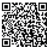
▲市PR映像「物語の生まれるまち我孫子」