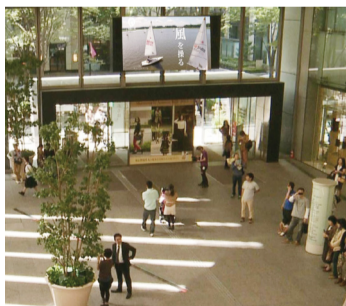
▲丸ビル(マルキューブ)での放映イメージ

◎ 県内初！丸の内ビジョンで「あびこの魅力CM」を放映!! 東京駅周辺のビジネス街(丸の内・大手町・有楽町)に建つ三菱地所20棟のビル内に設置された95台のモニターをネットワークした「丸の内ビジョン」で、「あびこの魅力CM」(15秒)を放映します。