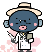
手賀沼のうなぎちゃん▲