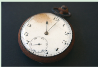
▲11時2分を指して止まったままの懐中時計