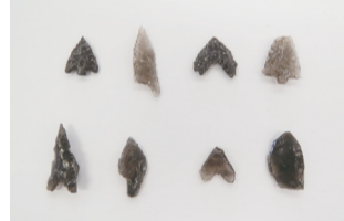
▲縄文時代の矢じり

黒曜石の原石や発掘調査で出土した黒曜石の矢じりなどを展示します。 日時 8月1日(火)～31日(木)(初日午後1時～、最終日午後4時まで) 場所 アビスタ2階オープンスペース展示ケース 問 教育委員会文化・スポーツ課 ☎7185-1583