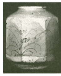
▲朝鮮陶磁器「染付秋草紋面取壺」

「民藝運動と我孫子」をテーマに開催します。市民スタッフによる朗読と、学芸員のトークをお楽しみください。 日時 8月27日(日)午後2時～3時 定員 先着20人(要申込) 費用 無料(要入館料) 入館料 300円(高校・大学生200円、中学生以下無料) 場所・問・図 白樺文学館 ☎7185-2192