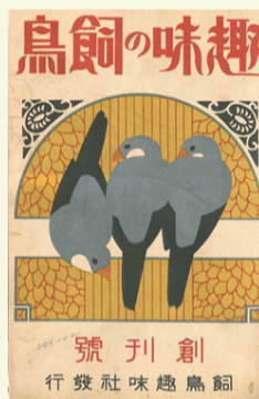
1921(大正10)年創刊の雑誌「趣味の飼鳥」▲