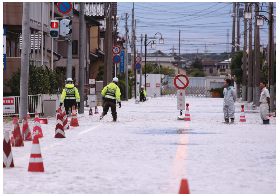
▲平成25年に発生した台風26号の市内の様子