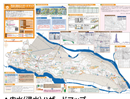
▲内水(浸水)ハザードマップ

防災マップや洪水・内水(浸水)ハザードマップ、日ごろの備えなど、市ホームページに掲載していますので、ぜひご覧ください。 問い合わせ 市民安全課・内線295