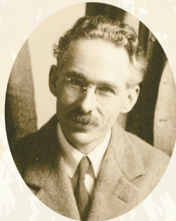
▲バーナード・リーチ(1935年)