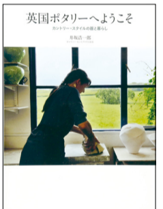
▲「英国ポタリーへようこそ」(井坂浩一郎著/世界文化社)

☎・☎ 11月16日(日)午前9時30分から図書館アビスタ本館 ☎7184-1110