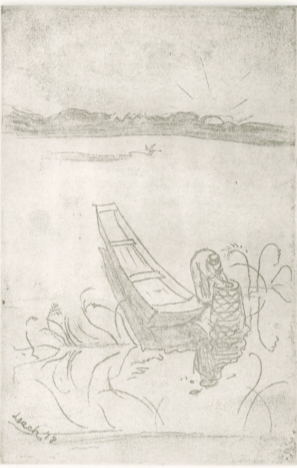
▲エッチング「手賀沼」The Lagoon of Teganuma, Abiko' Image by courtesy of the Leach Pottery and the Crafts Study Centre(白樺文学館所蔵)

日時 11月30日(木)～平成30年2月4日(日)午前9時30分～午後4時30分(入館は午後4時まで)