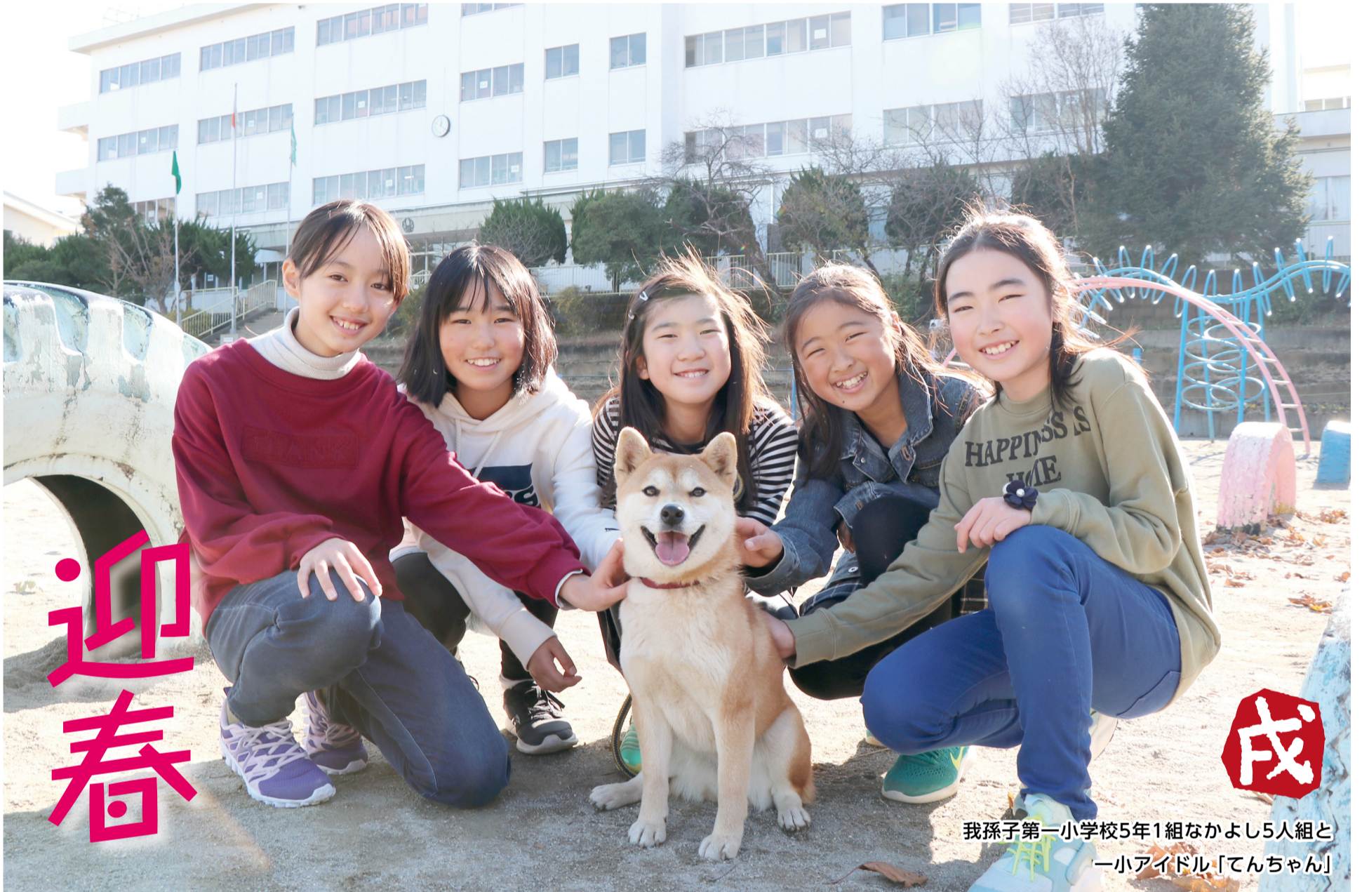
我孫子第一小学校5年1組なかよし5人組と 一小アイドル「てんちゃん」