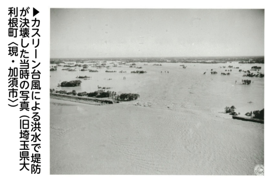
▶カスリーン台風による洪水で堤防が決壊した当時の写真(旧埼玉県大里町(現・加須市))

昭和22年9月のカスリーン台風は、利根川の各所で堤防決壊、氾濫が発生し、埼玉県東部地域から東京都東部地域まで水没させられた。その後も、近代的河川改修が進み水害の発生頻度が減少したことに伴い、社会の洪水氾濫に対する意識の低下が見られるようになり、利根川上流カスリーン台風70年実行委員会が今年1月に設立されました。今後、パネル展などさまざまな広報・啓発活動を通じて、社会全体で洪水氾濫に備える必要が高まっていることを伝えていきます。 ※「利根川上流カスリーン台風70年実行委員会」について、詳しくは国土交通省関東地方整備局利根川上流河川事務所ホームページ(「利根川上流河川事務所」で検索)をご覧ください。 ☎ 治水課・内線640