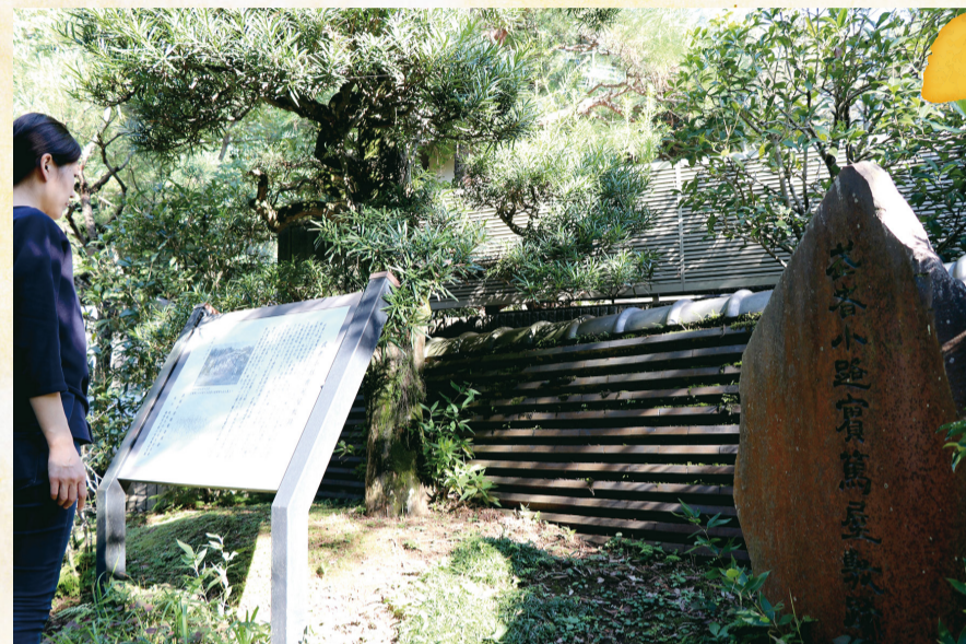
▲旧武者小路実篤邸跡にある案内板