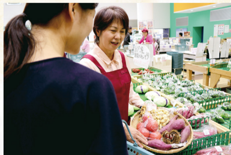
▲秋野菜が並ぶあびこん

水の館1階にある農産物直売所「あびこん」では栗やサツマイモなど秋の味覚が並びます。レストラン「米舞亭」では、季節の野菜を使った料理も楽しむことができます。