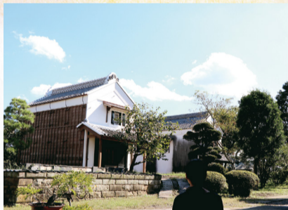
▲旧井上家住宅二番土蔵

ちば文化資産にも選ばれた文化遺産で落ち着いたひとときを。旧井上家住宅では、7月に二番土蔵の修理を終え、さらに江戸の風情を楽しめるようになりました(10月20日(土)にはイベントあり。詳しくは広報あびこ10月1日号をご覧ください)。近隣には伝統的な祭礼を行う竹内神社や宮ノ森公園などもあり、ゆったりとした時間を過ごせます。