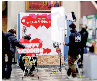
▲ドラマ撮影の様子

☎ フォトコーナー…市民課・内線320、ドラマ撮影…秘書広報課あびこの魅力発信室 ☎04-7185-2493