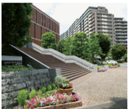
▲高層マンション街