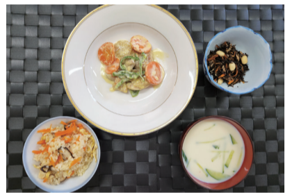
▲炊き込みご飯、鶏もも肉のクリーム煮など